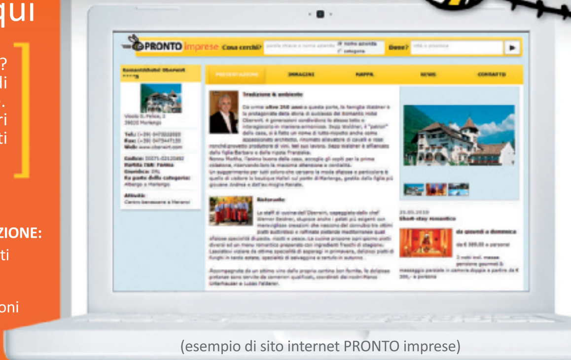
(esempio di sito internet PRONTO imprese)