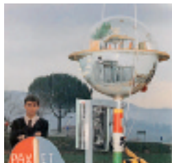
LANCIATO IN CIELO Una foto storica del «presepe francescano volante»